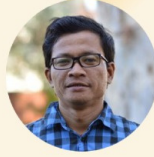
Usman Hamid Amnesty International Indonesia Digital Campaign